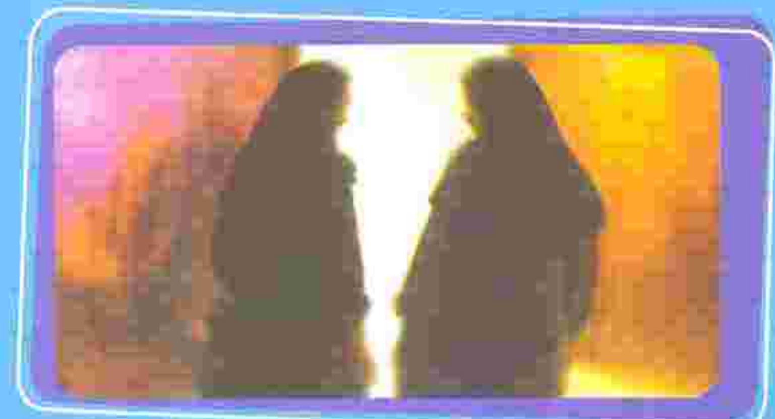
پاپ اسمیر! تشخیص سریع‌تر، درمان بهتر

❖ ۴۸ ساعت قبل از انجام آزمایش، شستشوی داخل مهبل با مواد ضد عفونی کننده صورت نگرفته و از کرم‌های واژینال (داخل مهبل) استفاده نشده باشد.